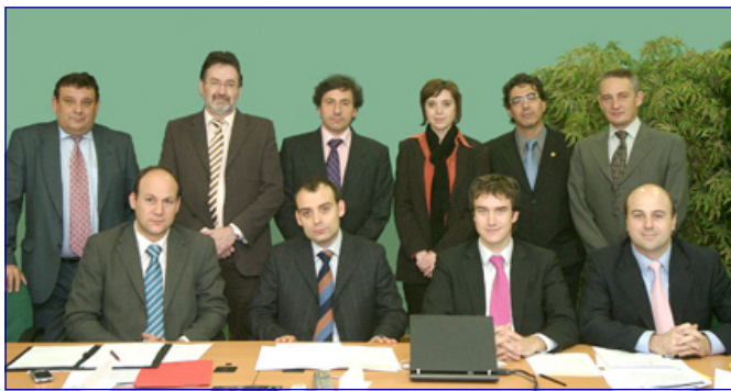
Reunió dels socis fundadors, 30 de gener del 2007

• Hem experimentat un augment continuat del nombre de visites mensuals a la web.